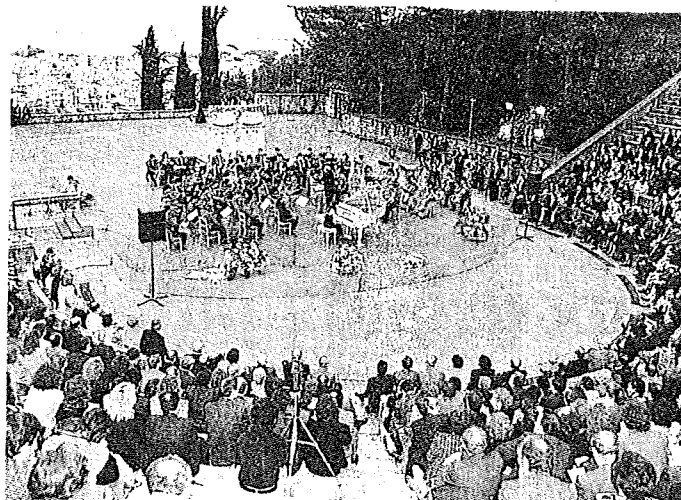
Avec les Eurochestries, la musique classique part à la conquête de l'Europe