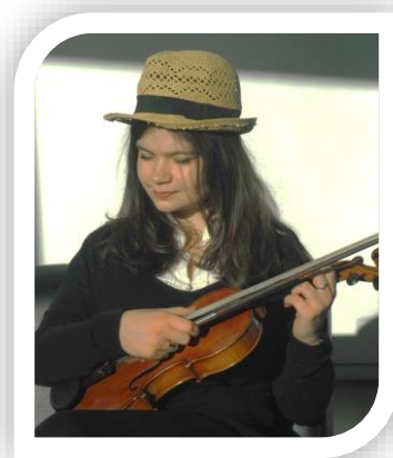
Quatuor Atypique, France