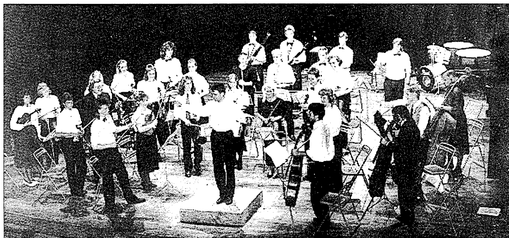
La jeunesse musicale européenne se retrouve en Saintonge

L'entrée à tous ces concerts est de 50 francs; gratuit pour les moins de 15 ans. Le concert de clôture, samedi 24 juillet à 18 heures à l'église de Jonzac, sera gratuit.