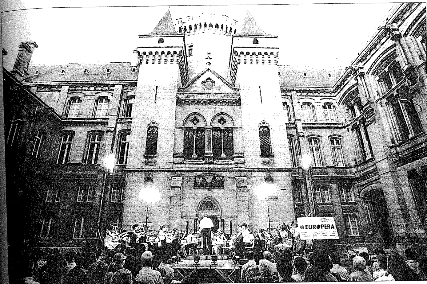
Dans la cour de l'hôtel de ville d'Angoulême

Les Eurochestries prennent fin ce soir avec la cérémonie de clôture à Jarnac. Une mise en parenthèses de cette aventure européenne