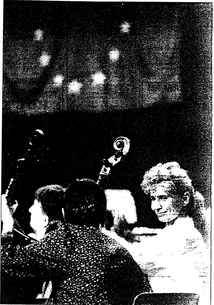
Les Eurochestreries sont l'occasion pour le public de découvrir des orchestres et des répertoires différents.

Leurs journées sont partagées entre des répétitions «européennes» et des concerts en formations «nationales». Chaque orchestre assure également une tournée de plusieurs jours en Charente et en Charente-Maritime.